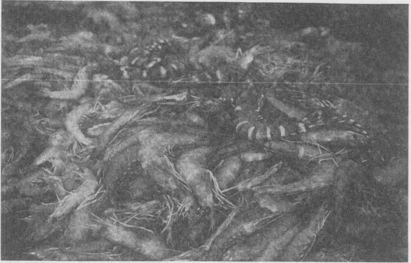
Häufig wurde Reisland in Garnelenteiche umgewandelt

ist. Nichts Außergewöhnliches also? Vielleicht doch, denn zeitgleich mit den Meldungen über die Hungertoten in Andhra Pradesh berichtete die indische Presse von der dritten Rekordernte hintereinander; trotzdem stiegen gerade in diesem Jahr die Preise für Nahrungsmittel stärker an als für andere Produkte. Es mag auch verwundern, daß die Opfer nicht in den trockenen und (land)wirtschaftlich wenig entwickelten Gebieten Andhra Pradeshs zu beklagen waren, sondern in den fruchtbaren und landwirtschaftlich hochentwickelten Flußdelten von Godavari und Krishna. Und es fällt weiter auf, daß die Opfer ausschließlich einer einzigen Berufsgruppe angehörten, nämlich der der Handweber.