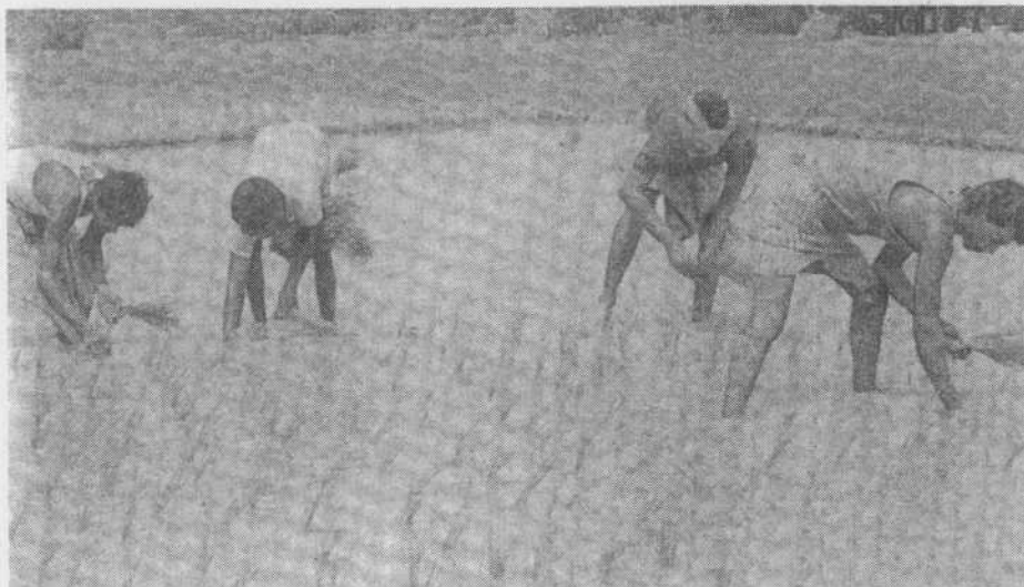
Wo hochertragreiche Getreidesorten gedeihen sollen, ist eine reichliche und gut kontrollierbare Bewässerung notwendig.

Was das für die Ärmsten in Indien bedeutet, wurde bereits wenige Monate, nachdem die ersten Strukturanpassungsmaßnahmen umgesetzt waren, spürbar. Als im Dezember 1991 Zeitungsberichte über Hungertote in Andhra Pradesh erschienen, zeigte sich, daß die Gefahr von Hungersnöten in Indien auch heute nicht vollkommen gebannt ist. An sich nichts Ungewöhnliches in einem Land wie Indien, in dem Hungersnöte jahrhundertlang zur gesellschaftlichen Realität gehörten. Nichts Ungewöhnliches in einem Land, das trotz aller agrartechnischen Verbesserungen nach wie vor von den Launen des Monsuns abhängig