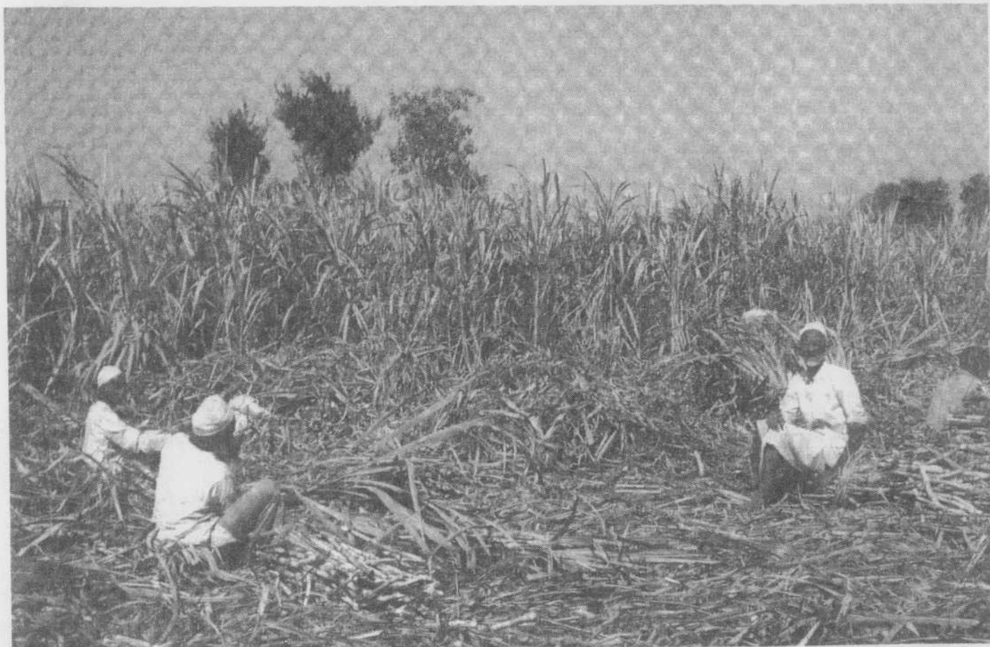
Vielen Bauern fehlt Geld, um sich ausreichende Nahrungsmittel oder eigenes Land zu kaufen

nahme der Bevölkerung schritthalten, bestätigte sich nicht. Rein rechnerisch stehen heute jedem Menschen in Indien mehr als 530 Gramm pro Tag an Getreide und Hülsenfrüchten zur Verfügung. Zur Unabhängigkeit waren es noch nicht einmal 400 Gramm. Statistiken verzerren jedoch die Realitäten. Wer nun annimmt, daß die gewaltigen Produktionssteigerungen Hunger und Unterernährung in Indien beseitigen konnten, der irrt. Auch heute lebt noch mehr als ein Drittel der indischen Bevölkerung (mehr als 300 Millionen Menschen) unterhalb der Armutsgrenze, die über den Wert einer ausreichenden Ernährung berechnet und festgelegt wird. Die Erfolge an der "Produktionsfront" konnten keine ausreichende Ernährung aller InderInnen sicherstellen. Zur Lösung dieses Problems bedarf es primär keiner weiteren Produktionssteigerungen. Es fehlt vielmehr das Geld in den Händen vieler Menschen, um sich ausreichende Nah-